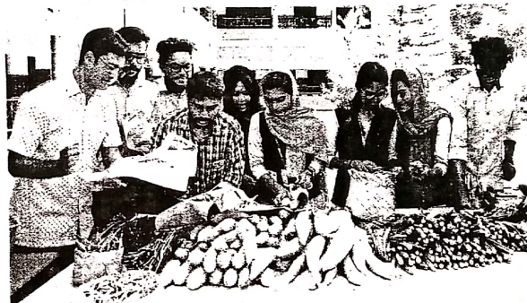
ക്യാമ്പസിൽ ഉൽപാദിപ്പിച്ച ലൈവ് പച്ചക്കറികളുമായി എടത്തല അൽ അമീൻ കോളജ് വിദ്യാർത്ഥികൾ.

■ അധികമാകാതെ ജീവകാരുണ്യം ആശുപത്രിയ്ക്കു വേണ്ടതിനേക്കാളധികം പച്ച